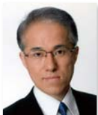
藤村 博之 法政大学大学院 教授