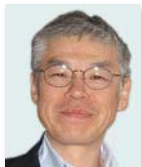
守島 基博 一橋大学大学院 教授