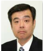
八代 充史 慶應義塾大学 教授