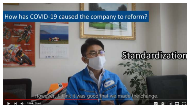
カイゼンに積極的に取り組む企業（株式会社ササキ）の COVID-19 対応の紹介

同教材の中ではカイゼンの基本的な考え方を紹介し、COVID-19 の状況を踏まえた 3 つのステップとして「従業員・顧客、パートナーの安全確保」「事業継続」「ニューノーマルに対応する内部の変革」を示した上で、実例として、カイゼンに積極的に取り組み、COVID-19 を受けて、社内の感染防止や、業務の見える化、Digital Transformation(DX 化)を推進する日本企業のインタビューや、カメルーンでカイゼンを導入し新たにマスク生産に取り組む企業の紹介がされました。