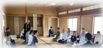
第99期5月例会 座禅体験会の様子

業界を超えた人事部門の方々との情報交換で、新たな気付きがあり、今後の施策検討の参考になった。