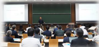
第100期10月例会 講演の様子(一橋大学)