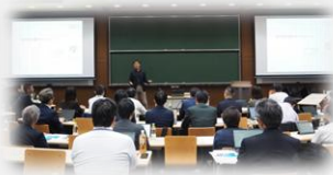
第100期10月例会 講演の様子(一橋大学)