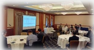
会場での講演の様子(日本工業倶楽部)

業界を超えた人事部門の方々との情報交換で、新たな気付きがあり、今後の施策検討の参考になった。