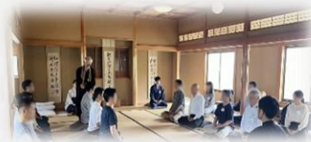
第99期5月例会 座禅体験会の様子