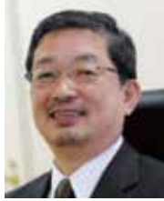
石井 淳蔵 神戸大学・ 流通科学大学 名誉教授