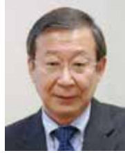
池尾 恭一 明治学院大学 教授