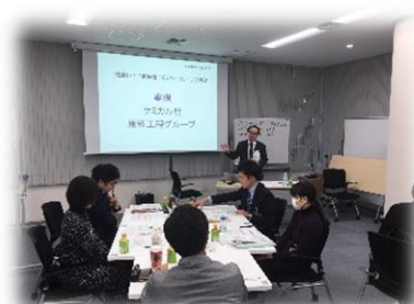
行動計画の策定・発表