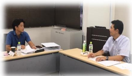
専門家との討議・個別アドバイス