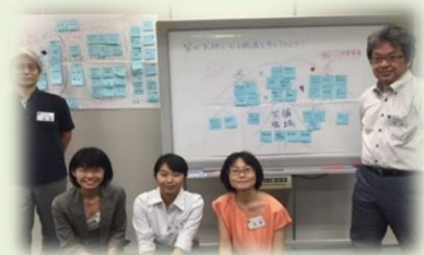
ワークショップでの交流