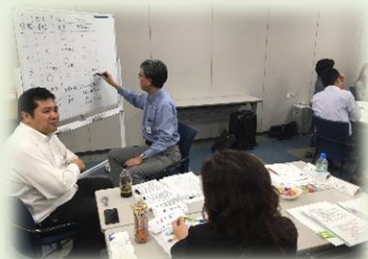
他社メンバーとの協力・学び合い

株式会社SUBARU 株式会社ニチレイ 株式会社コトリ 三菱商事株式会社 三菱電線株式会社